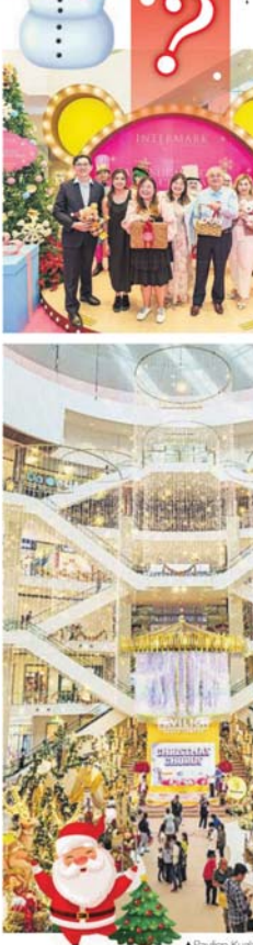
▲Pavilion Kuala Lumpur最受注目的中央大厅被打造为华丽的Christmas Musical Carousel。

Pavilion Kuala Lumpur今年以“Christmas Chorus 2025”盛大开启圣诞序幕,整个商场化身为一个以音乐、光影与星光为主题的节庆舞台,带来多层次的沉浸式体验。最引人注目的中央大厅,被打造为华丽的Christmas Musical Carousel,以璀璨的Christmas Star为核心亮点。金色光片、瀑布式灯带与星光般的LED投影,营造出如梦似幻的氛围,象征着希望、希望与新征程的开始。极具童话感的音乐角色陆续登场:Santa in Style、Woodland Chorus、Penguin Chorus与Polar Bear Chorus,仿佛走进了童话世界。 今年的另一大亮点是Chanel的《The Enchanted Symbols - Winter Constellation》,以5大象征:麋鹿、狮子、山茶花、小鹿、珍珠作为灵感,主入口处呈现出耀眼的光影装置,展现品牌独特的节庆美。整个节日期间,Centre Court将举行多场节目,包括合唱、舞蹈、芭蕾舞和小提琴演奏等。圣诞老人也将在不同时段分列于Centre Court、Connection、Fashion Avenue和Tokyo Street现身,为大家带来惊喜互动和拍照时刻。