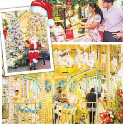
▲The Exchange TRX中央区的一座华丽旋转木马。

Intermark Mall与San-X Japan合作,打造今年东南亚唯一Rilakkuma圣诞主题展示。