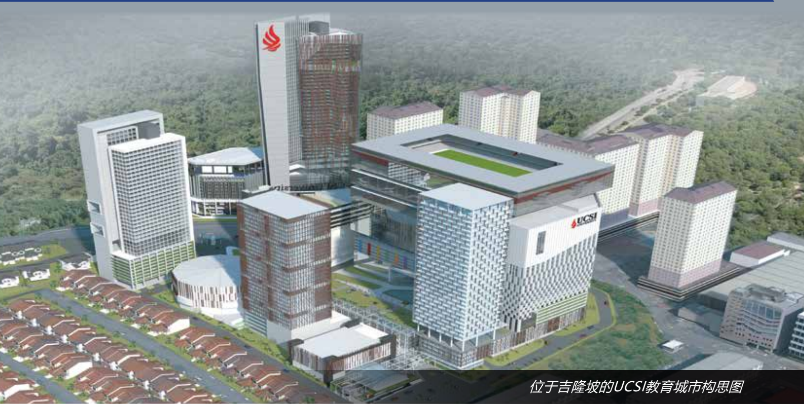
位于吉隆坡的UCSI教育城市构思图