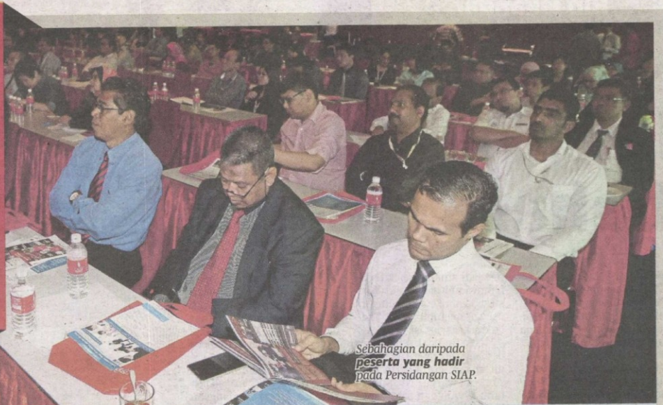
Sebahagian daripada peserta yang hadir pada Persidangan SIAP.