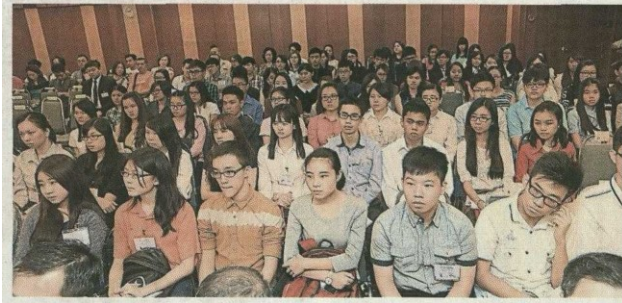
众奖学金得主在家长陪同下,出席星洲日报教育基金颁奖礼,踏出升学梦的第一步。