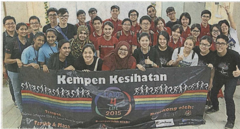
■UCSI大学生走进社区，举办“关爱生命”健康觉醒运动。

(吉隆坡2日讯)UCSI大学与挚爱基金会(Yayasan Generasi Gemilang)日前举办健康觉醒运动，提供各项健康检查及咨询服务，以提升社区健康及保健意识。